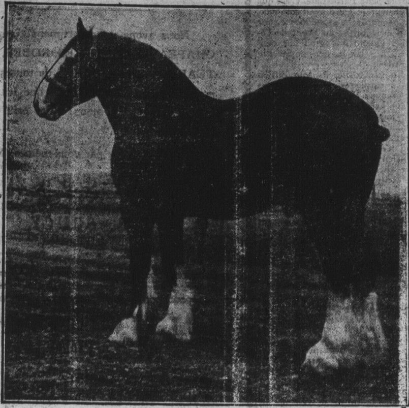
Etalon Clydesdale Importé