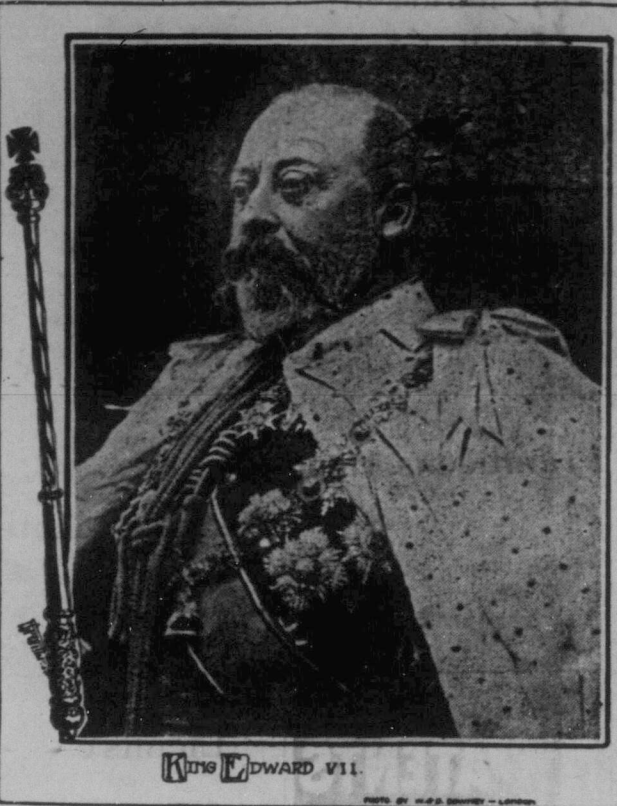
Konung Edward VII.

— Järnvägskommissionen i Ottawa har utställt en order för en korsning af Canadian Northern och Lake Superior banan på N.W. 31. 38. 4 w 3. De nödvändiga säkerhetsapparaterna skola installeras.