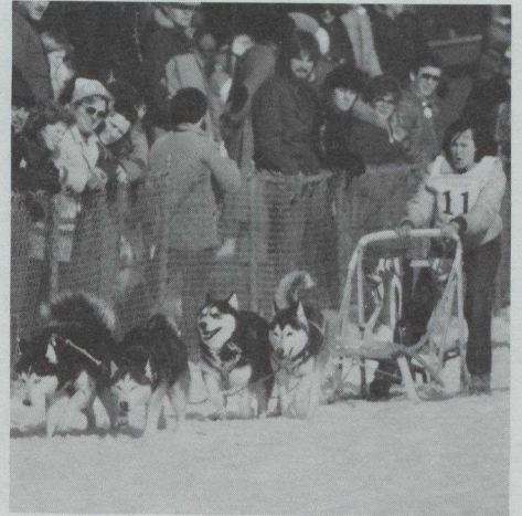
Adiestrados a tirar de los trineos, estos perros pueden alcanzar velocidades de más de 30 km por hora.

Como todos los años, el Canal Rideau, convertido en la pista de patinar más larga del mundo (7,8 km), estuvo abierto todos los días. Los altavoces instalados amenizaban con música los paseos sobre el canal helado, tanto por el día como por la noche. El paseo culminaba en el Lago Dow, donde, como salidas de un libro de cuentos, se levantaba un centenar de esculturas de nieve, erigidas sobre el helado lago por estudiantes de escuelas secundarias y universidades, empleados del gobierno federal y del sector comercial, así como el público en