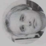
T. D. マギキ ● 金鋼 ● 鉱産物 ● 石油 ● エネルギー資源 ● 以外の工