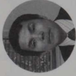
鍵 謙 ● 穀物 ● 油糧 ● 商務官