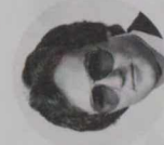
B. C. カンケン ● 石油 ● 天然ガス ● 海洋開発機器 ● 輸送機器 ● 1等書記官

食品関係では、日本の消費者のカナダ産品に対する理解は、まだまだの状態にある。たとえばカナダにはスパゲッティやワインの非常にいいものがあるが、日本でそれを知っている人は少ない。そのほかハチミツ、果実加工品(とくにベリージャム)などもカナダが誇りうる食品だ。そこで当セクションとしてはこうしたカナダ食品の宣伝が一大任務となってくる。有名デパート等でのカナダ食品フェア、有名ホテルのレストラン・ショーのお世話を積極的にやっている。来年三月の東京晴海の国際食品展にも初参加する予定。カナダ産食品の輸出振興には、両国の食品衛生法規の違いが一つのネックとなっており、このため担当者は日本の関係法規に関する資料を作成するなど、カナダ側の理解を深める努力を続けている。