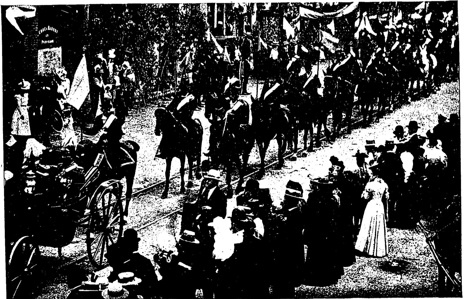
LE CHIEF SUPRÊME DES FORESTIERS INDÉPENDANTS OROHIVATEKHA.