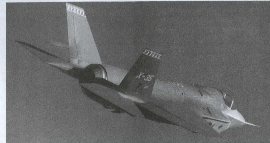
La société Applied Courseware Technology du Nouveau-Brunswick a obtenu un contrat avec Lockheed Martin dans le cadre du projet F-35 Joint Strike Fighter de 270 milliards de dollars.