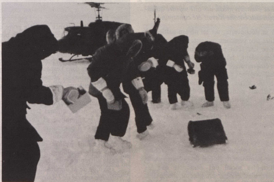
Découverte de débris sur le Grand Lac des Esclaves.

L'assemblage de tiges et de tubes fut retrouvé sur la surface glacée de la rivière Thelon, située au nord-est du Grand Lac des Esclaves; la découverte fut faite au début du mois de février par un groupe d'hommes séjournant dans la région. Quant au tube en forme de tuyau de poêle (seule pièce de débris non radioactive), on l'a retrouvé sur la surface