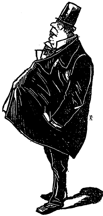
Un yankee que la vue du palais de glace rend froid !

Il n'y a pas moyen de les éviter de loin, comme dans la rue.