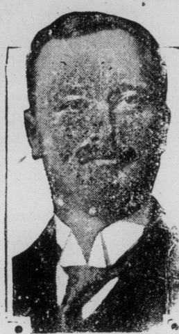
L'HON. E.-L. PATENAUDE brisera aux élections prochaines le "bloc solide" de Québec.