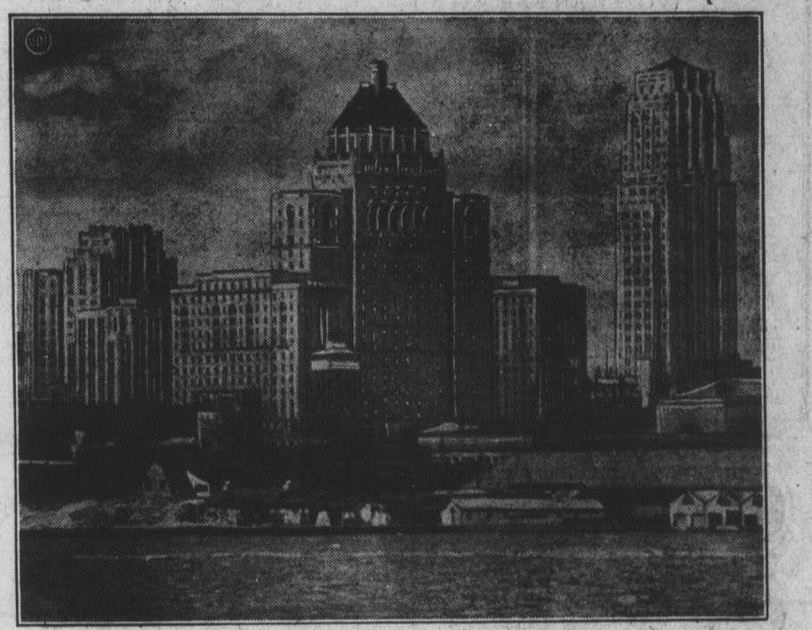
LE PANORAMA DE TORONTO Cette vue unique de Toronto prise de la jetée du port de cette ville donne une idée vivante de l'expansion extraordinaire prise par la Ville-Reine depuis le commencement de 1928. Au centre de la gravure, on aperçoit l'hôtel "Royal York" du Pacifique Canadien, le plus grand hôtel de l'Empire Britannique; à gauche les bureaux du journal le "Star" et, à droite, l'édifice imposant de la Banque du Commerce.