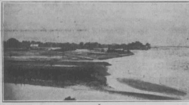
Над річкою за Косовом в часі повені в 1927 році.