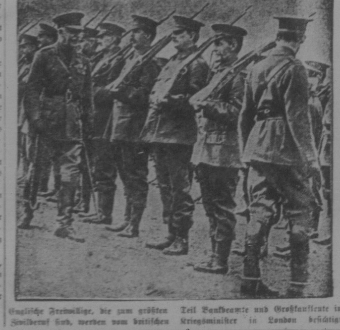
Englische Freiwillige ...

Bergeht nicht, jeden Brief und jede Postkarte mit einer Kriegsmarke zu versehen. Anstatt einer Kriegsmarke darf auch eine gewöhnliche Ein-Cent-Briefmarke verwendet werden