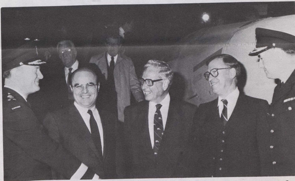
(Izquierda a derecha): El Teniente General Lewis; el Ministro de Suministros y Servicios, Blais; el Presidente de la McDonnell Douglas, Malvern; el Ministro de Defensa, Lamontagne; y el General de Brigada Slaunwhite reciben el primer CF-18 de Canadá. La foto superior muestra la maqueta del avión.

mundo, reemplazará a los CF-101 Voodoo utilizados actualmente por las Fuerzas Armadas.