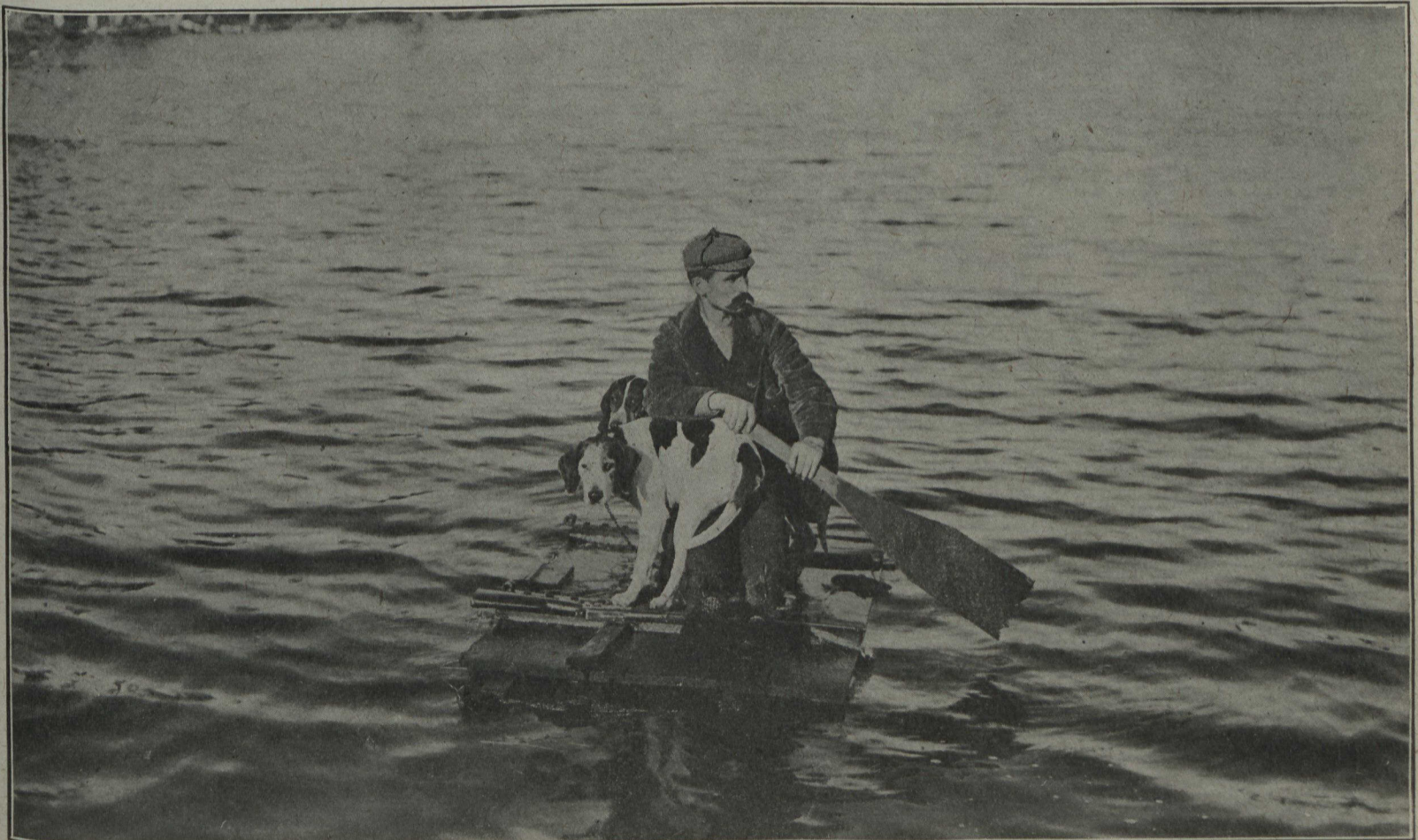
A LA CHASSE AU CERF EN ONTARIO: Sur un minuscule radeau, un chasseur traverse la rivière Maganetawan, avec ses chiens — Ligne du G. T. R.