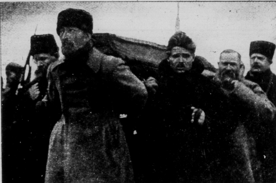
Передові члени Російської Комуністичної Партії несуть тіло В. І. Леніна на місце вічного спочинку.