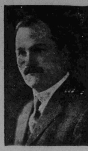
Premiärminister C. A. Dunning, av Saskatchewan kungör ett överskott i sitt tal över budgeten.