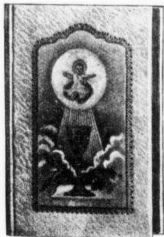
Reliure No 155

Papier blanc, gros grains, vignette dorée sur plat, tranche blanche.