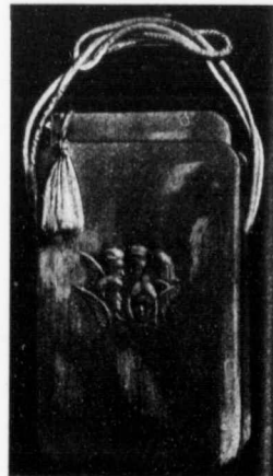
Reliure 824, Etui No 4

Celluloïd imitation nacre, blanc, capitonné, avec floche, sans fermoir, tranche dorée, coins arrondis. Rénfermé dans un magnifique étui celluloïd avec poignée de cuir solide.