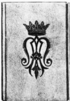
Reliure No 128

Celluloïd ferme plié, chromo, fermoir celluloïd coins arrondis, tranche dorée.