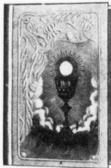
Reliure No 805

Celluloïd blanc veiné, capitonné, avec floche, sans fermoir, tranche dorée, coins arrondis.