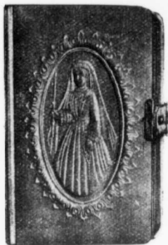
Reliure No 807

Celluloïd fort, blanc, relief, fermoir celluloïd, coins arrondis, tranche dorée.