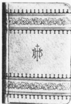
Reliure No 129

Leatherette blanche capitonnée, colorée à la main, coins arrondis, tranche dorée.