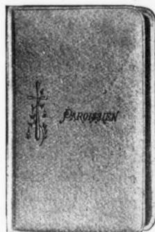
Reliure No 153

Celluloïd blanc plié, relief, fermoir celluloïd, tranche dorée.