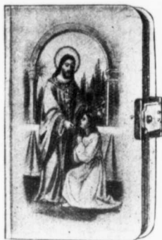
Reliure No 826

Celluloïd fort, blanc, relief, fermoir celluloïd, coins arrondis, tranche dorée.