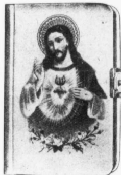
Reliure No 810

Celluloïd transparent, plié ferme, sujet chromo et dessin en relief, sans fermoir, tranche dorée.