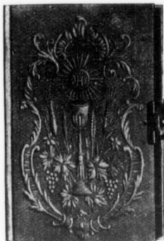
Reliure No 829

Celluloïd ferme, avec chromo et cadre en or, fermoir celluloïd. Coins arrondis, tranche dorée.