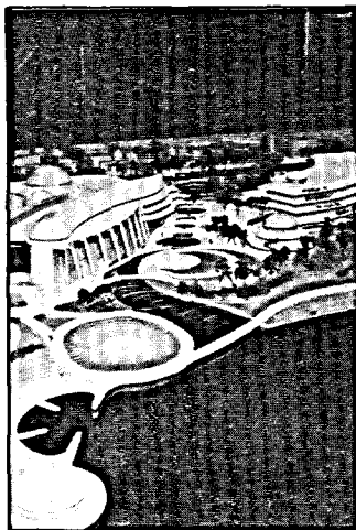
Musée de l'homme

maquettes laissent muet d'admiration. L'architecte albertain Douglas Cardinal dit que le Musée de l'homme sera plein de vie — un peu comme Disney World. Imaginez deux édifices reliés par une série de bassins décoratifs conçus pour donner l'impression de communiquer avec la rivière. Situé dans le Parc Laurier, à Hull, ce musée fera face aux édifices du Parlement. Quant à la Galerie nationale, elle sera logée dans un immeuble de trois étages de verre, de cuivre et de pierre. Une rampe de 80 mètres aboutira au dôme vitré de 36 mètres de haut du grand hall d'entrée faisant face lui aussi à la colline parlementaire. L'architecte montréalais Moshe Safdie veut que son œuvre « baigne dans une atmosphère calme, feutrée... qu'elle soit en quelque sorte la salle de séjour de la ville ». L'immeuble sera situé à l'angle des rues Sussex et St-Patrick.