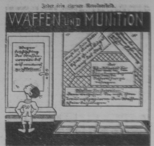
Wenn das mit der Schießerei weiter so in Höhe bleibt, werden die Waffenhandlungen bald ein bedeutendes Geschäft werden.

Richten Sie Ihre Anfragen an: British Columbia Colonization Board Distrik-Agenten der Provinzial-Regierung 543 Grandville St., Rooms 714—715 Power Bldg., Vancouver, B.C. Anfiedlung, Affidavits, Schiffsfahrten, Gebührensicherung, — rechtliche und ärztliche Hilfe.