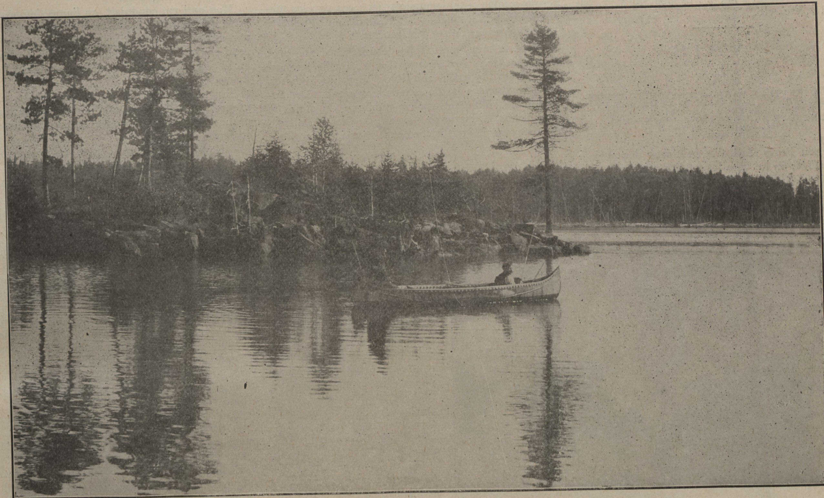
La baie au foin, lac Kipawa, P. Q., ligne du C. P. R.