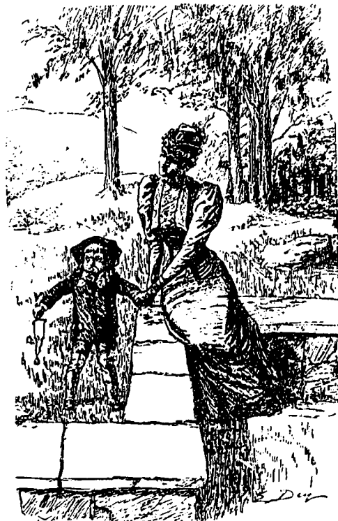
La tante. —Ne sais-tu pas que c'est vilain de chercher à tuer les pauvres petits oiseaux ? Bébé. —Vilain ! Tu crois cela, toi ? Chaque fois que maman me donne la volée pour un mauvais coup, c'est toujours un petit oiseau qui le lui a dit