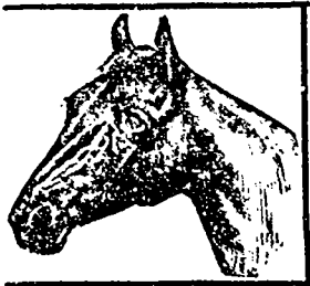
Marque de Fabrique