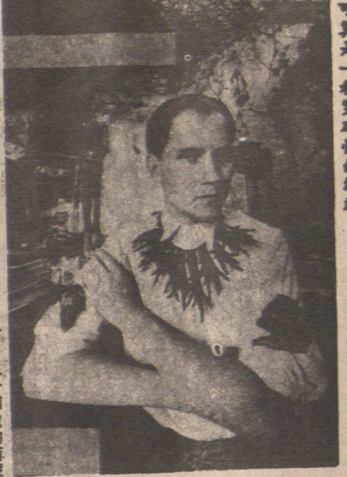
這位首飾設計師想到將寶玉石鑲嵌在動物屍骨裏，可算是一種突破性的構思。

最新的一種珠寶飾物，是用什麼製成的？是鑽石、黃金和各種寶石，鑲嵌在動物屍骨上，成為一件件精緻、恐怖而又帶着神秘色彩的珠寶。這件珠寶，叫「骷髏首飾」。 美國有人開了家骷髏首飾店，而倫敦的著名珠寶設計師西摩·麥基斯，則把動物屍骨製成首飾。他製成的一件首飾，是用一隻死貓的屍骨製成的。這件首飾，是用一隻死貓的屍骨製成的。這件首飾，是用一隻死貓的屍骨製成的。