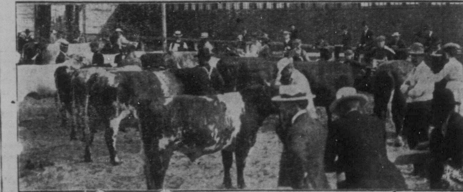
SCENER FRÅN BOSKAPSTÄLLNINGEN