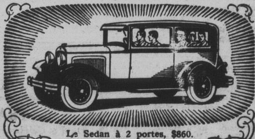
Le Sedan à 2 portes, $860.

Les passagers du Plymouth ont plus de sécurité par des