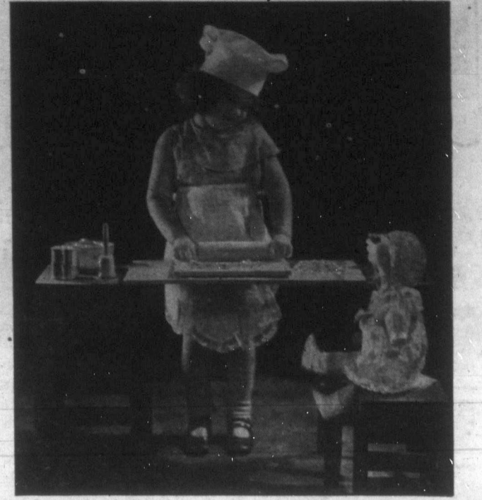
A magyar lányok már kicsiny korukban megtanulják szeretett édes anyjuktól a sütés-főzés tudományát s így fognak még övtizedek múlva is dicsőség-e szerezni a magyar névnek s megbecsülést — önmaguknak!

szerecsné: ő fogja majd meg-teremteni a "boldog" társadal-mat. De ez nem akar mindent, mert nincsen is mindenre azok uralommal rendelkező ember a sége.