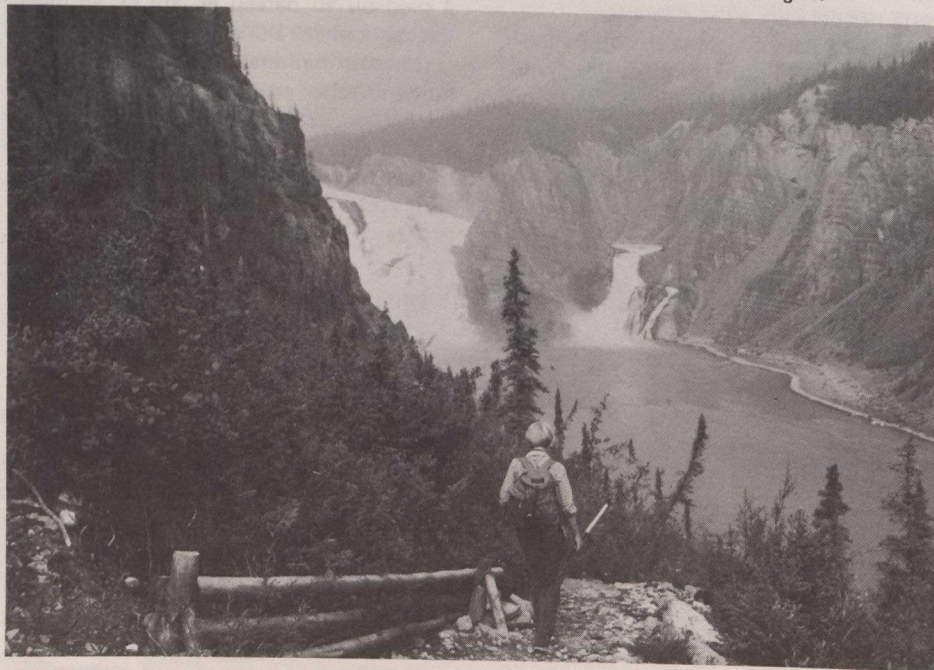
Le parc national Nahanni, dans les Territoires du Nord-Ouest, est célèbre pour ses panoramas saisissants et les chutes Virginia, deux fois plus hautes que les chutes du Niagara.

— Le parc national Kluane , au Yukon, est parcouru de deux rangées de hautes montagnes dont l'une est le mont Logan, qui, avec ses 5 951 mètres d'altitude, est le plus élevé au Canada. En dehors des régions polaires, ce parc est une des zones que la glace recouvre en majeure partie. On y trouve des pics élevés, d'immenses vallées et des lacs de montagne.