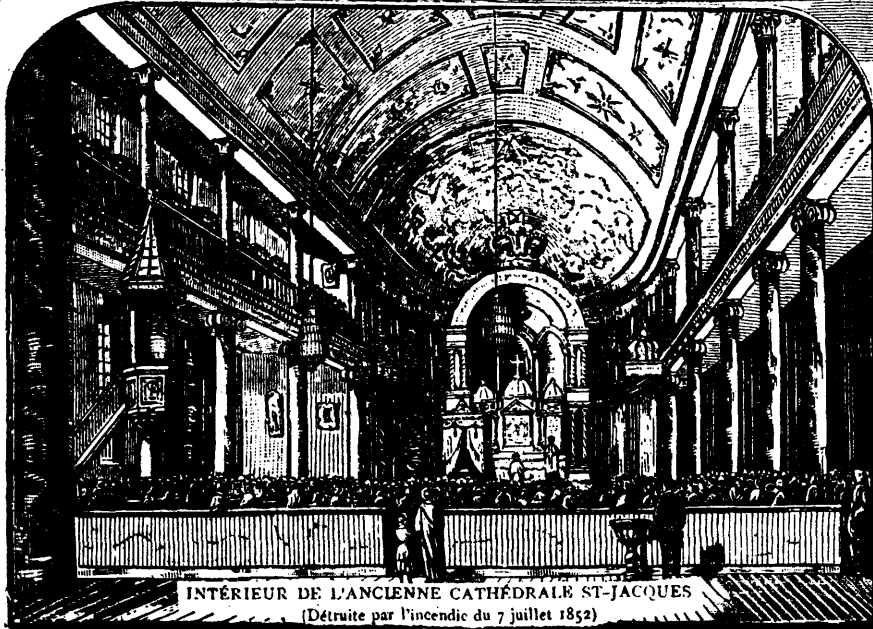
INTÉRIEUR DE L'ANCIENNE CATHÉDRALE ST-JACQUES (Détruite par l'incendie du 7 juillet 1852)