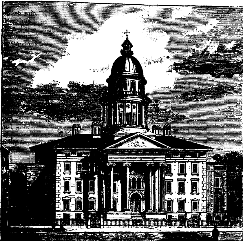
LE PALAIS ÉPISCOPAL DE ST-JACQUES, A MONTRÉAL. (Détruit par l'incendie du 7 juillet 1852)