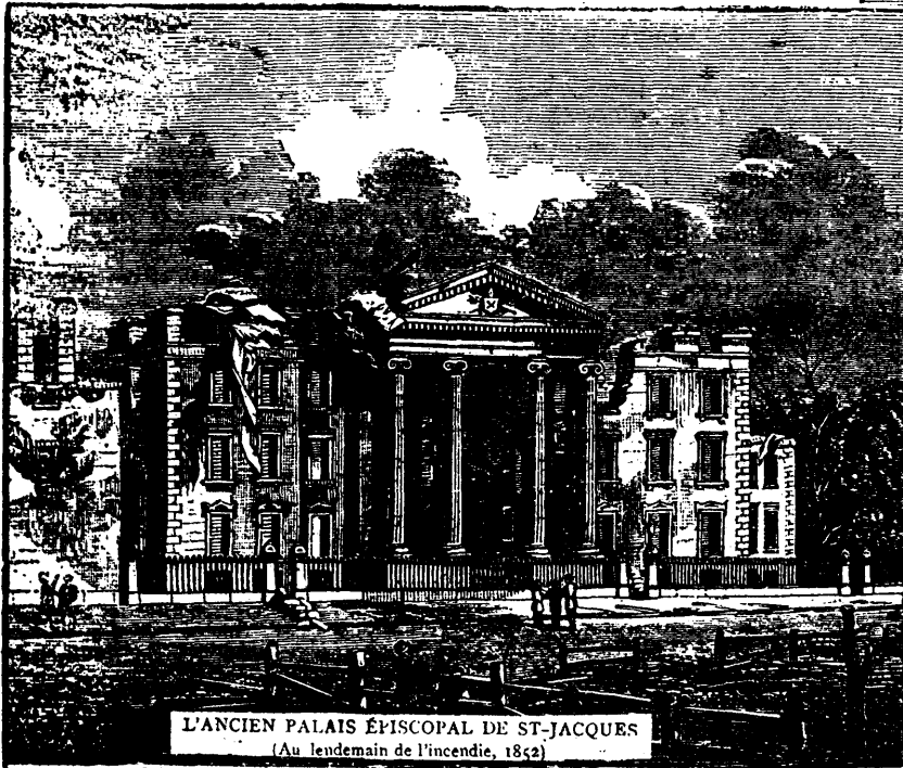
L'ANCIEN PALAIS ÉPISCOPAL DE ST-JACQUES (Au lendemain de l'incendie, 1852)