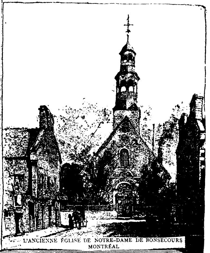
L'ANCIENNE ÉGLISE DE NOTRE-DAME DE BONSECOURS MONTRÉAL