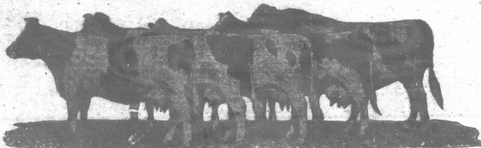
Un groupe de Holstein de réputation internationale appartenant à la Mount Victoria Farms, et comprenant le Fameux Jokanna Rag Apple Patst

Donc, qu'on se le dise et qu'on ne retarde pas trop ses expéditions, sous le prétexte de faire prendre du poids à ses veaux. On sait, d'ailleurs, que le meilleur poids pour vendre un veau de lait est de 80 à 100 livres.