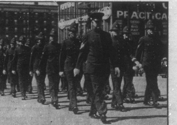
Mint minden évben, úgy az idén is felvonult a winnipégi rendőrség június 6-án. Az imponáló menetet a járőrelők ezrei nézték végig.