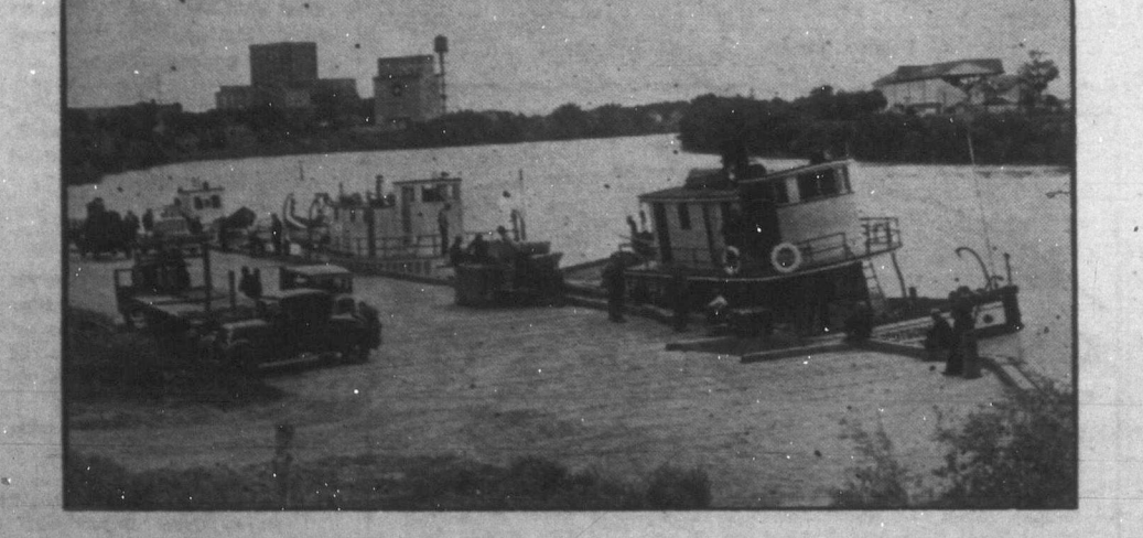
Megérkezett Winnipegre az első tavaszi halszállítmány az északmanitobai Berens folyó vidékéről. A manitobai halásztársaságok évenként sok ezer láda halat szállítanak az Egyesült Államokba és Angliába.