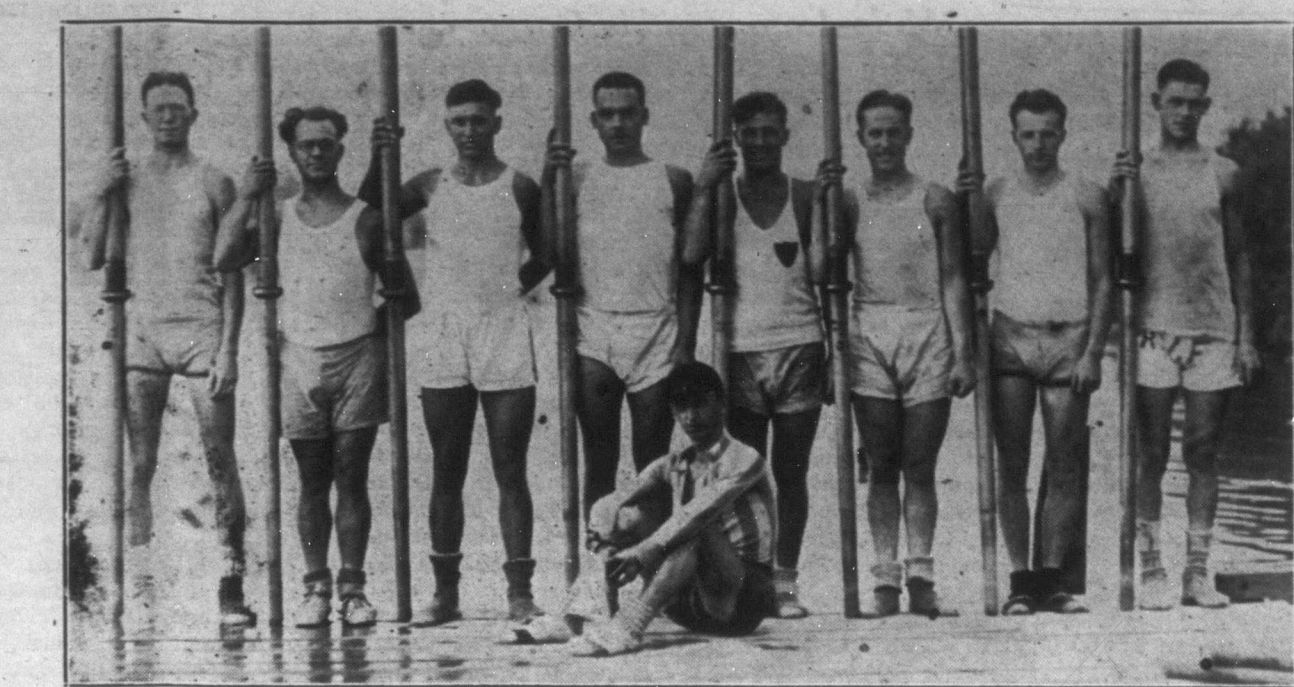
Kanada tavalyi bajnok evezős csapata erősen készülődik az idén is megtartandó versenyekre.

TIROLBAN Virgen melletti Mitterdorfbán egyszerre négy helyen tűz ütött ki. Rövid idő alatt az egész falu lángokban állt. Husz lakóház teljesen leégett, 90 ember hajléktalanná vált. A hatóságok megállapítása szerint a tűz kommunista merénylőre vezethető vissza.