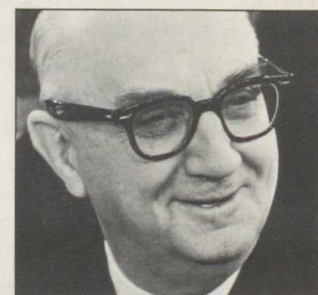
M. Joey Smallwood

M. Joey Smallwood, soixante-seize ans, a renoncé en juin dernier à son siège de député à l'assemblée législative de Terre-Neuve et s'est retiré de la vie politique. Ancien premier ministre de la province, il restera dans l'histoire canadienne l'artisan de l'entrée de Terre-Neuve dans la Confédération. Il se consacra à cette tâche dès 1946, alors que Terre-Neuve avait le statut de colonie britannique. Deux ans plus tard, il fit adopter par les Terre-neuviens, après deux référendums successifs, l'entrée du territoire dans la Confédération. Terre-Neuve devenait en 1949 la