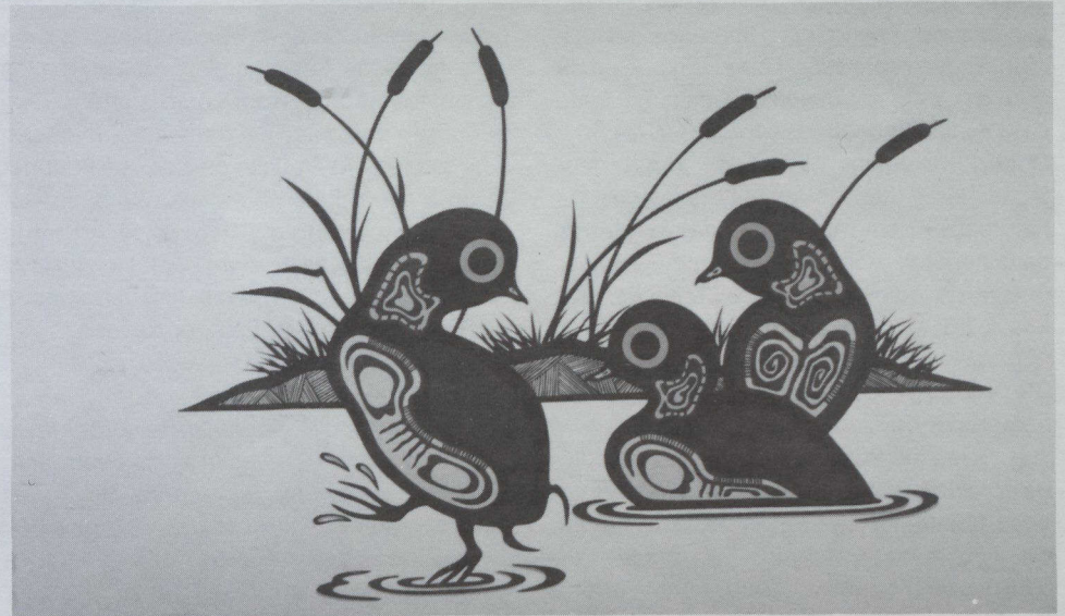
El Pequeño Lider, grabado del artista indio Robert Kakegamic, reproducido en una tirada de número reducido de ejemplares que ha puesto a la venta la Great Canadian Print Company.

En la Feria Internacional de Primavera '85, que estuvo abierta en Birmingham, Inglaterra, del 3 al 7 de febrero, ocho compañías canadienses mostraron muchos artículos para regalos de gran calidad.