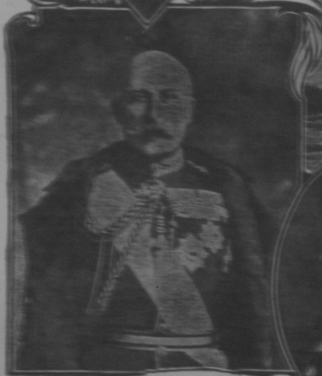
Her Royal Highness the Duke of Cornwall