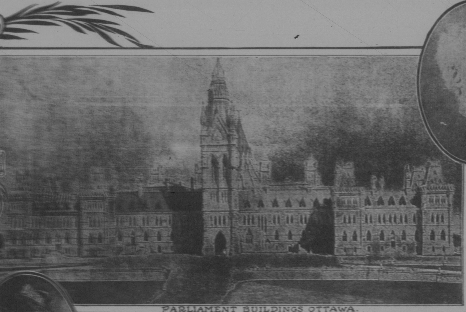
PARLIAMENT BUILDINGS OTTAWA.