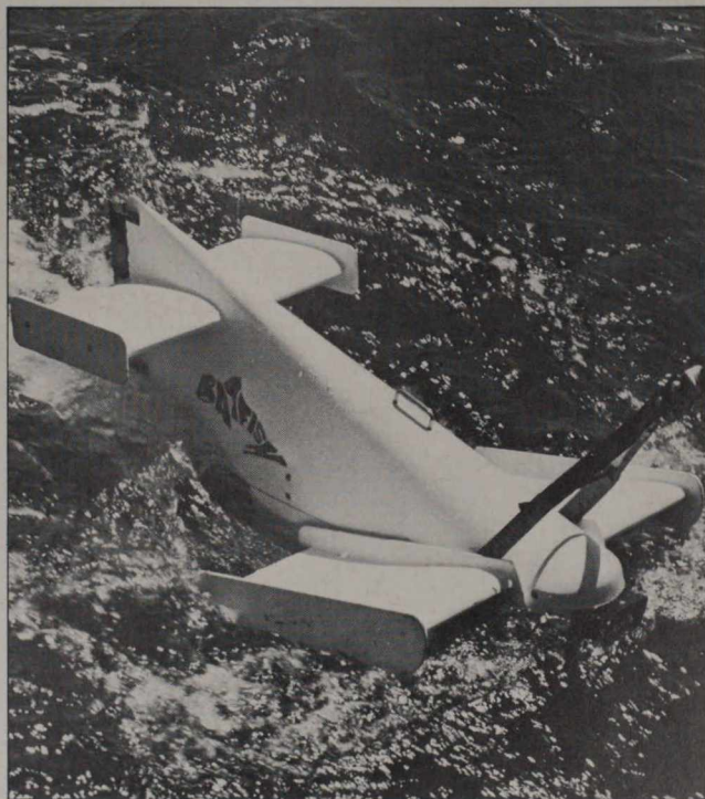
Le Batfish : avant la mise à l'eau et avant la plongée.

L e Batfish est un véhicule de recherche océanographique qui permet de mesurer en continu les données de base du milieu marin - la température de l'eau, sa teneur en sel ou en plancton, etc. - en fonction de la profondeur. C'est un engin sous-marin remorqué sur lequel est montée une batterie de capteurs spécialisés, par exemple une sonde STD, qui enregistre automatiquement la température, la pression et la conductivité électrique de l'eau à des profondeurs déterminées, un fluorimètre très sensible, qui donne la teneur en phytoplancton des couches supérieures de l'océan, un compteur de zooplancton. Le véhicule "vole" sous l'eau en suivant une trajectoire pré-