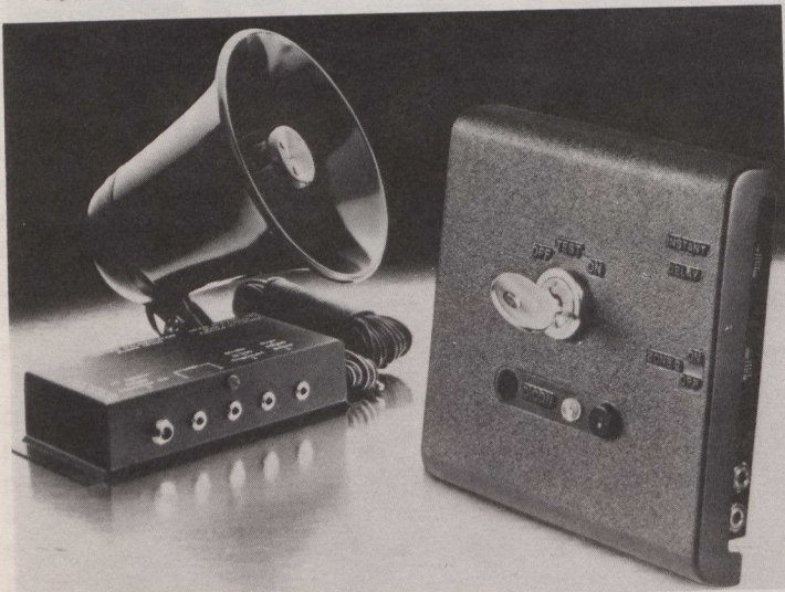
Dicon Systems Limited conçoit, fabrique et commercialise des détecteurs destinés aux résidences et aussi des systèmes d'alarme contre les cambriolages tel celui qui apparaît sur la photo. Cette entreprise a obtenu le premier prix d'excellence à l'exportation.