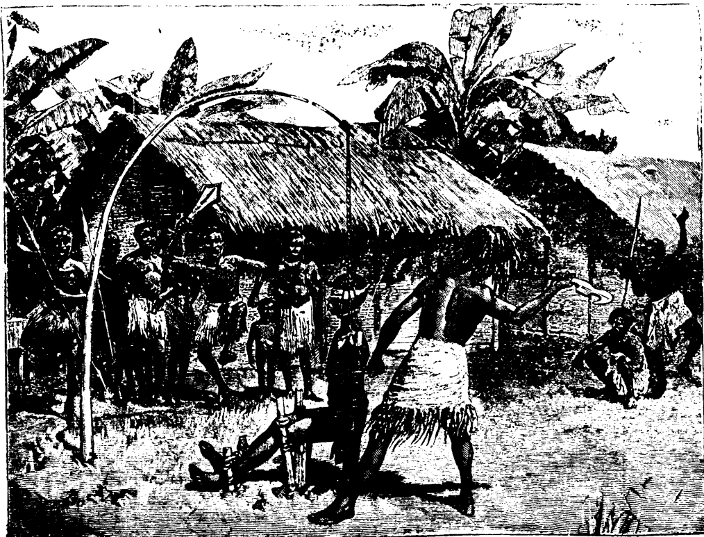
D'un seul coup, l'exécuteur sépare la tête du corps.—Page, 529, col. 2.