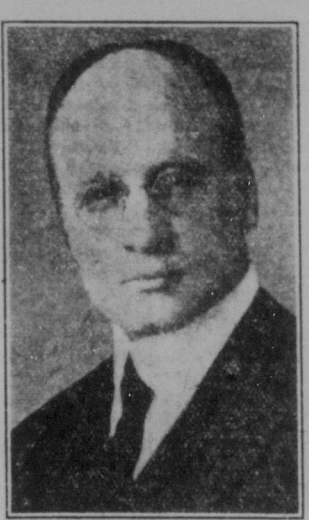
Hon. HARRY STEVENS.