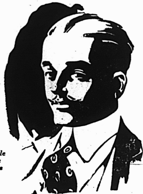
Nouvelle forme ajustée