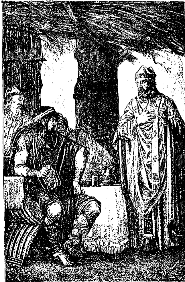
Quelle est la Scène historique dont on a le dessin sous les yeux