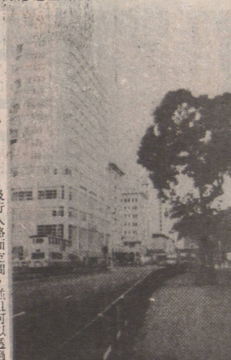
交式形新要需，橋車多人區舊咀沙尖 導疏具工通

九龍半島交通發展商表示，興建的高架鐵路將採用輕軌系統，每列車可載客六百名。收費暫定不逾三元。路軌離地五米半，較輕鐵更輕巧。發展商還表示，興建高架鐵路將有助於改善尖沙咀的交通狀況，並連接區內的市政設施，如政府大樓、法院、學校等。