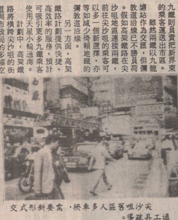
交式形新要需，橋車多人區舊咀沙尖 導疏具工通

【本報專訊】九龍半島交通發展商表示，興建的高架鐵路將採用輕軌系統，每列車可載客六百名。收費暫定不逾三元。路軌離地五米半，較輕鐵更輕巧。發展商還表示，興建高架鐵路將有助於改善尖沙咀的交通狀況，並連接區內的市政設施，如政府大樓、法院、學校等。