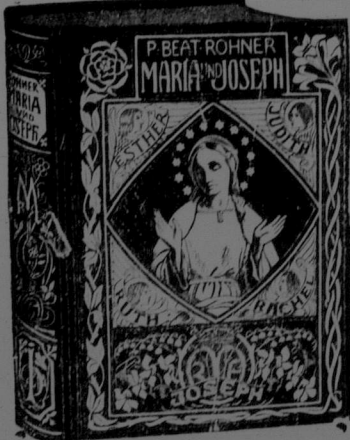
Einband zu Rohner, Maria u. Joseph.

Das Leben der allerheiligsten Jungfrau und ihres glückseligen Bräutigams, verbunden mit einer Schilderung der vorzüglichsten Gnadenorte und Verehrer Mariens. Von Peter Beat Hobner, O. S. B., Priorer.