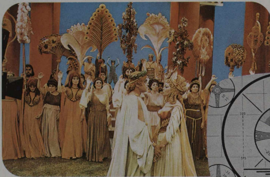
"La bella Helena", producción de la CBC en francés para el programa "Les beaux dimanches".

CUARTA PARTE (Continúa del número anterior)