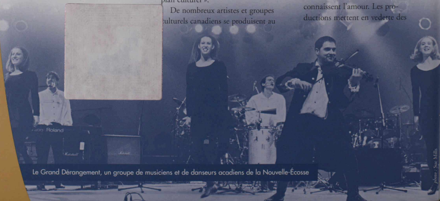
Le Grand Dérangement, un groupe de musiciens et de danseurs acadiens de la Nouvelle-Écosse