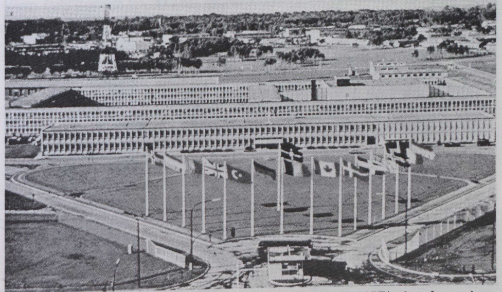
Grand quartier général des puissances alliées en Europe (SHAPE), dans les environs de Mons (Belgique).

La réunion du mois dernier, s'inscrivait dans le prolongement des sommets des