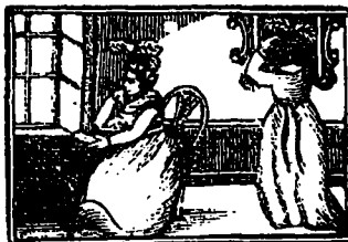
CUNÉGONDE CHEZ MADAME BELTAPET

La servante devait faire la cuisine et le lavage de la maison, répondre à la porte et raccommoder le linge à ses moments perdus.