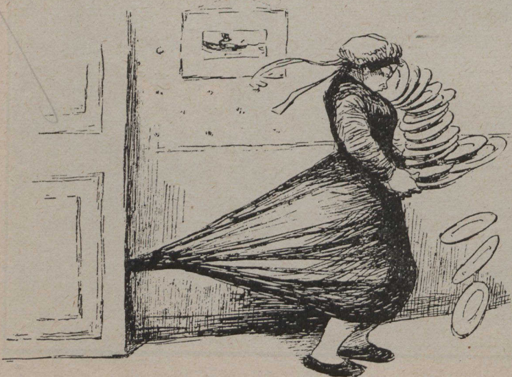
La porte pincee