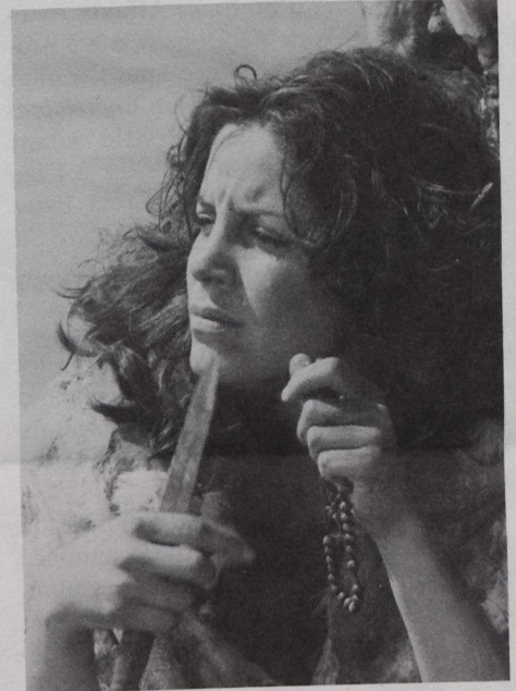
Marguerite de Roberval (Céline Lomez), héroïne de Morooned in the Land God gave to Cain .

Le deuxième épisode, Morooned in the Land God gave to Cain , retrace la vie mouvementée de Marguerite de Roberval. L'histoire commence en 1542, quand un vaisseau venant de France se dirige vers le Nouveau-Monde. A bord, une jeune femme, la nièce du capitaine, tombe