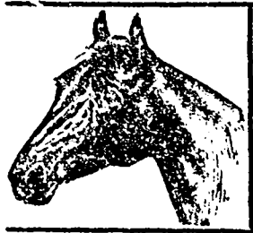
Marque de Fabrique