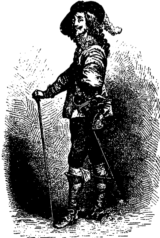
Quel est le Portrait représenté dans le Dessin qu'on a sous les yeux?