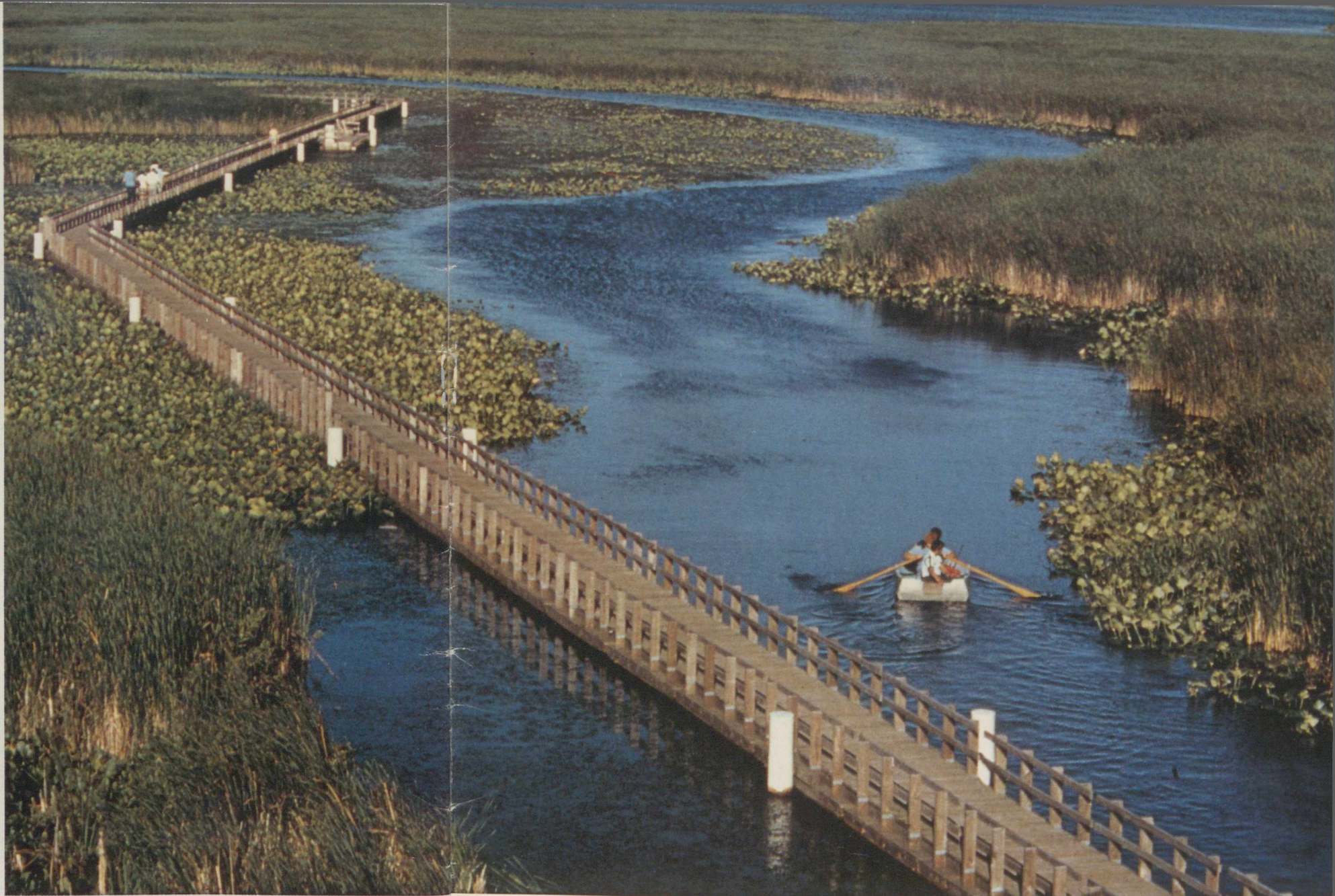
Parque Nacional de Point Peles (verão) — Ontário.